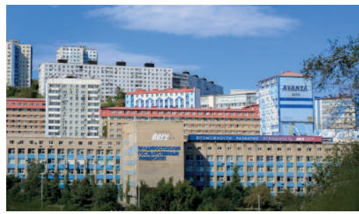
Владивостокский государственный университет