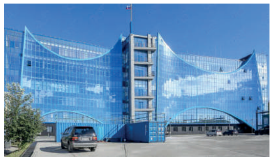
Морской государственный университет им. адм. Г. И. Невельского