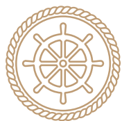
Лучший вахтенный помощник