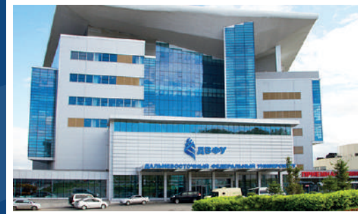
Дальневосточный федеральный университет