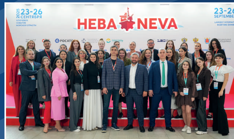
Команда «НЕВЫ-Интернэшнл» на выставке НЕВА 2025

Присоединяйтесь к конкурсу! Вместе возьмем курс на мастерство и докажем высокий профессионализм специалистов отрасли