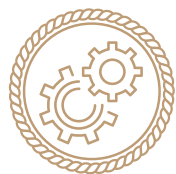
Лучший вахтенный механик